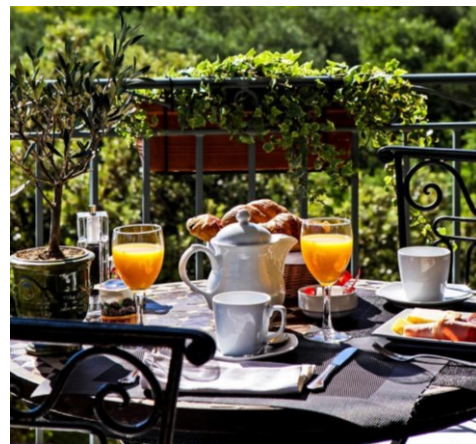
Petit déjeuner buffet